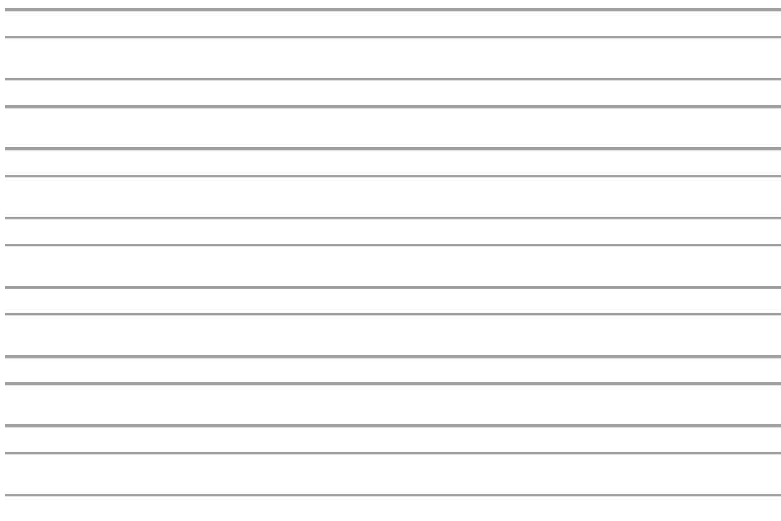
Imagen 6. Actividad 2. Plantilla. Fuente: elaboración de la alumna.

Tanto la plantilla que usaremos como un ejemplo de dictado, aunque puede variar dependiendo de la gramática que se esté dando en ese momento en el aula, podemos encontrarlos a continuación.